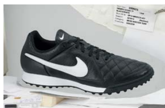
Nike Tiempo Genio leather TF