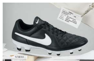
Nike Tiempo Genio leather FG